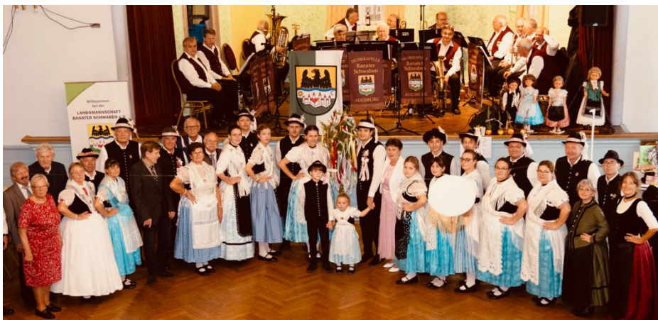
Gruppenfoto im Saal mit Vortänzerpaar, Kirchweihpaaren, Ehrengästen, Musikkapelle Banater Schwaben Augsburg und Vorstand.