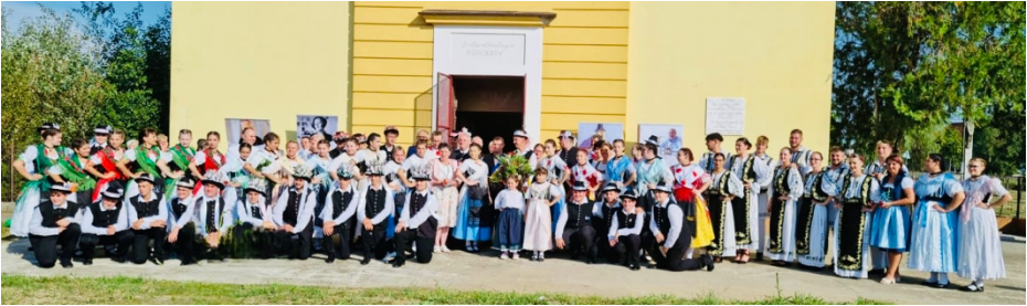
Gruppenbild mit 30 Kirchweihpaaren und Ehrengästen vor der Kirche nach dem Festgottesdienst.