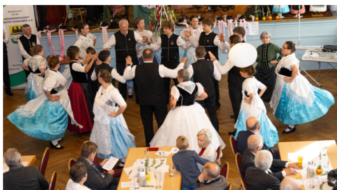
Kulturprogramm mit der Tanzgruppe der Banater Schwaben Augsburg mit starker „Nitzkydorfer“ Beteiligung.