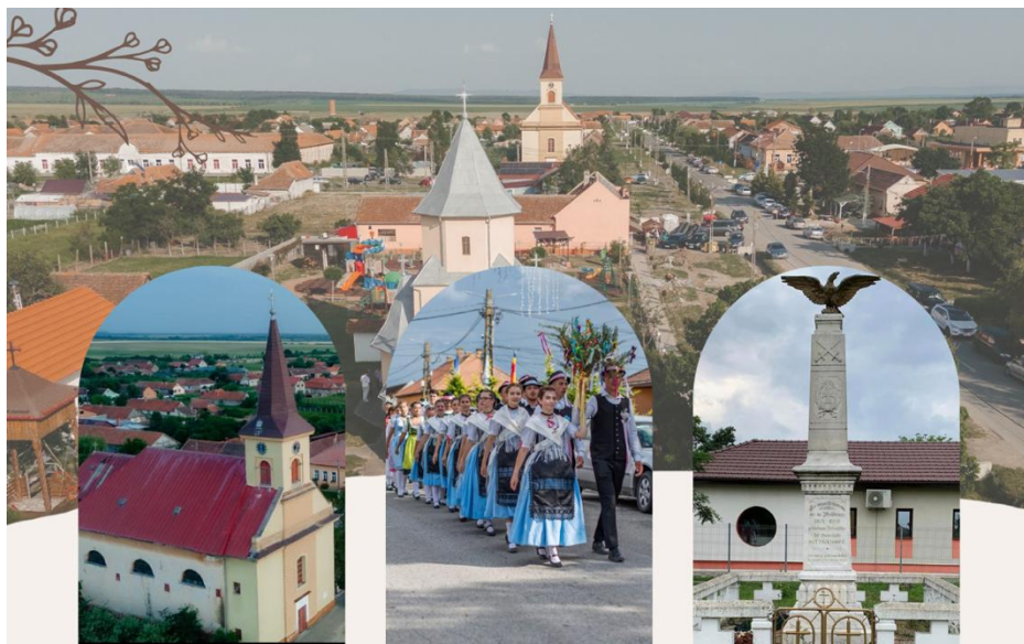
200+1 Jahre römisch-katholische Kirche Nitzkydorf